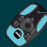
El equipo (Bittium Faros™)