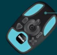
L'appareil (Bittium Faros™)